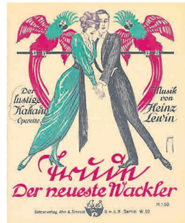
Der Wiesbadener Komponist Heinz Lewin schrieb u.a. die Musik zur Operette „Der lustige Kakadu“ (Poster: „Trude – Der neueste Wackler“).