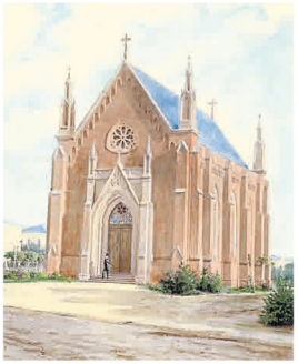
Die Englische Kirche Wiesbaden bald nach dem Neubau von 1865